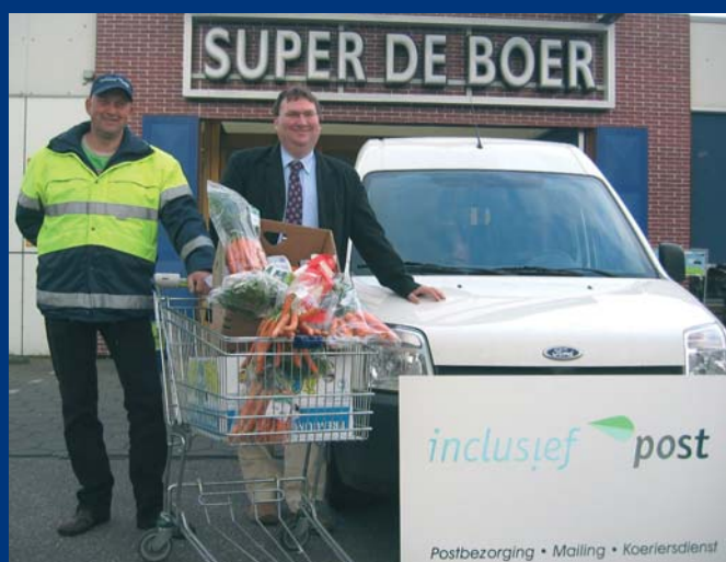
Inclusief Post gaat boodschappen bezorgen voor Super De Boer

S uper de Boer in Nunspeet gaat samenwerken met Inclusief Post. De bezorgservice, het thuis laten bezorgen van de boodschappen, wordt met ingang van 1 juni uitgevoerd door medewerkers van Inclusief Post. Daarmee breidt