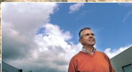
Dubbelrol tussenpersoon leidt tot faillissement