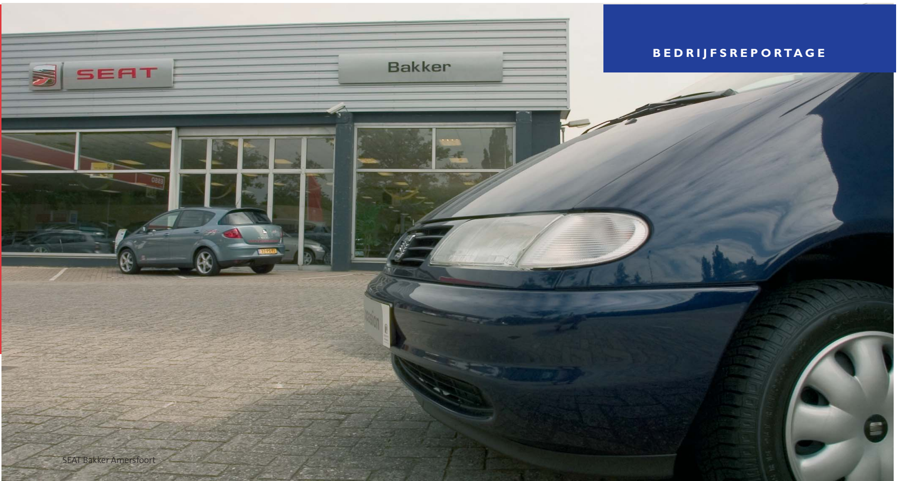
SEAT Bakker Amersfoort