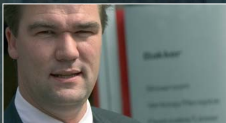
SEAT Bakker 75 jaar jong