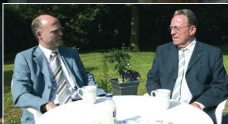
Het gaat goed met de Bedrijvenkring Ermelo