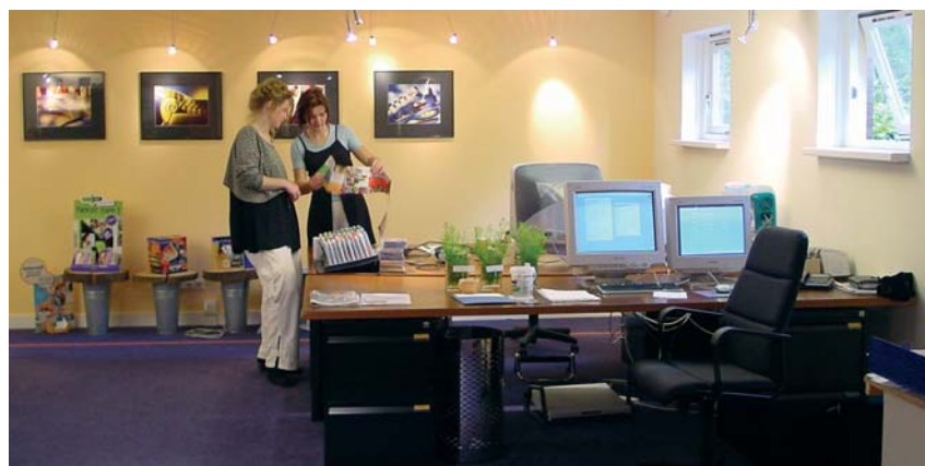
"Denken op breed niveau"

Van de economische recessie heeft het bureau geen last gehad. Dit komt doordat Veen een betrouwbare partner is en opdrachtgevers weten dat. Een andere belangrijke reden is de verscheidenheid aan klanten die het bedrijf heeft. "Wij werken niet voor één bepaalde branche, dat geeft een bedrijfs-economische stabiliteit. Wij hebben veel grote bedrijven als klant, maar maken ook prachtige dingen voor lokale ondernemers. Door voor verschillende klanten en doelgroepen te ontwerpen, blijven wij scherp en alert en weten we iedere keer weer met origineel product te komen."