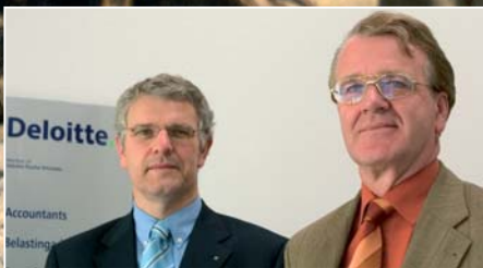
Onderwijs en bedrijfsleven vinden elkaar steeds beter